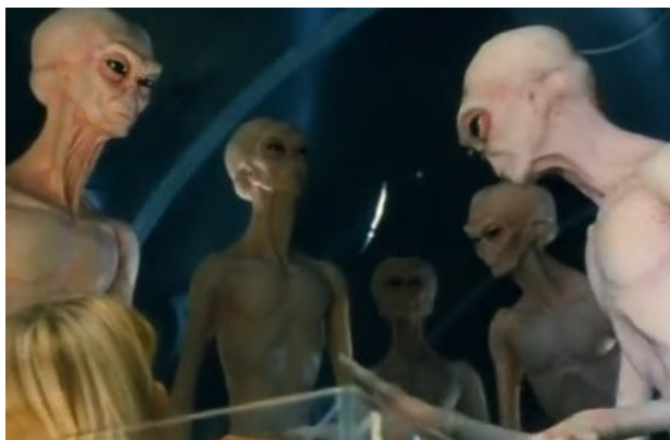
Image d'abduction d'une personne humaine

Sachez qu'aucun des planificateurs Kadistu n'a jamais dévoilé son véritable nom à un humain et ne pourra venir à votre rencontre dans votre densité. Toute cette hypocrisie ne provient pas d'êtres qui sont réellement au service de l'Homme. Les planificateurs vous respectent et ne vous font jamais de fausses promesses.