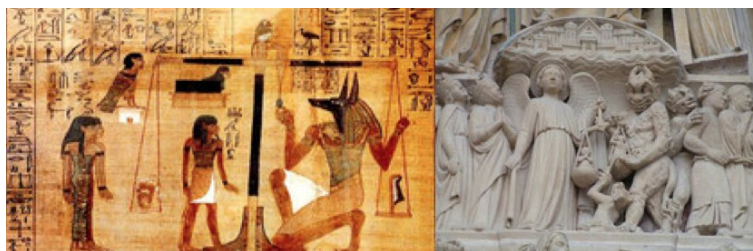
La pesée de l'âme dans les traditions

Sachez que vos programmes humains deviendront complètement obsolètes dans les dimensions de conscience plus évoluée. Pour arriver à la conscience qui est la vôtre actuellement, il est intéressant de vous remémorer les différentes étapes de votre propre progression. Dans les traditions, cela correspond à la pesée de l'âme. Cette "pesée" correspond à l'évaluation du niveau vibratoire, que l'âme accomplit elle-même. Au plus celui-ci est élevé, au mieux l'âme de l'individu est apte à passer dans les dimensions supérieures.